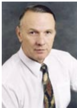
Юрий Савельев, депутат Государственной думы, народный министр образования

Поэтому молодые люди так активно идут в нашу партию, и партия «Патриоты России» им соответствует.