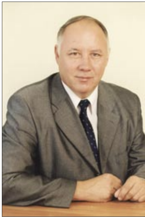
Олег Корякин, депутат Законодательного Собрания Санкт-Петербурга, лидер петербургского отделения партии «Патриоты России»

— Партия «Патриоты России» - это единственная партия, которая предложила целостную систему мер и конкретный план действий, определяющий, что необходимо реально сделать в стране. Партия представила понятную и близкую российскому народу общенациональную идею: «Справедливость для всех и счастье для каждого!»