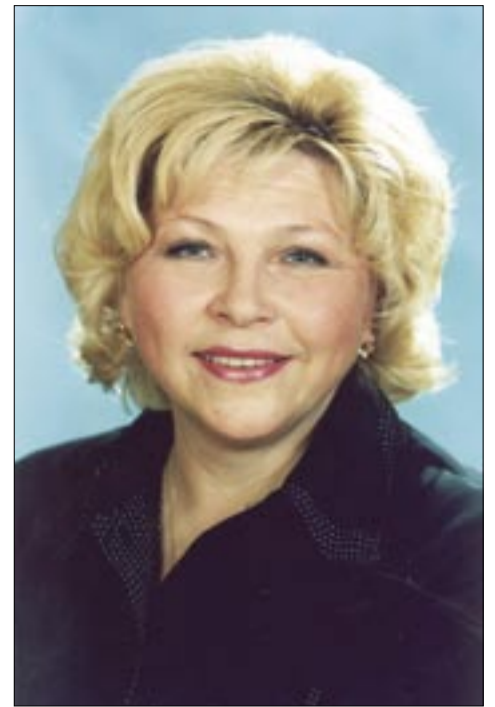
Елена Драпеко, депутат Государственной думы РФ, член партии «Патриоты России», народный министр культуры, заслуженная артистка России

— Есть вечные ценности — такие, как совесть, честь, справедливость, Родина. Сегодня эти вечные ценности находятся почти в забвении, и их необходимо возрождать.