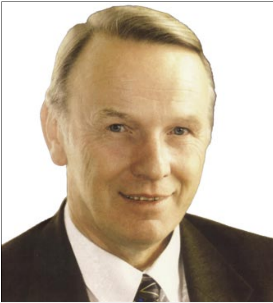
Юрий Савельев, депутат Государственной думы, народный министр образования, доктор технических наук, профессор

На сегодняшний день «Патриоты России» — самая молодая и динамично развивающаяся партия в стране.